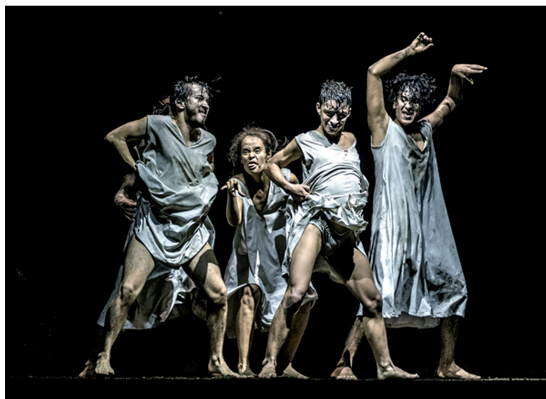
El Festival de Teatro Alternativo-Festa, fundado hace más de 20 años, llegó al escenario virtual para continuar legitimando la dramaturgia colombiana.

“Cuando se abran las salas seremos los mismos, pero seremos otros, el público y la sociedad, y habrá que encontrar un lenguaje diferente que nos pueda identificar y representar. Todas las grandes crisis dejaron una vanguardia de cómo vernos en esa diferencia, y tendremos que expresarlo de todos los modos posibles. De ahí saldrán grandes obras”, ha dicho el dramaturgo y líder de la compañía cubana Argos Teatro, Carlos Celdrán; la vida y el tiempo le darán la razón.