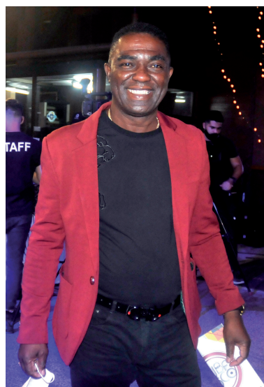
Manolito Simonet dirigió La alianza musical de Cuba en el disco Al son del caballero , en homenaje al maestro Adalberto Álvarez.