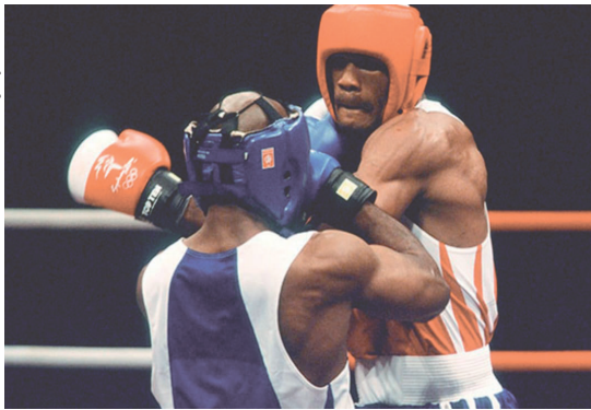
Savón también llegó a tres de oro en Sídney.

Las nueve de oro: Yumileidi Cumbá (Atletismo/Bala), Osleidys Menéndez (Atletismo/Jabalina), Equipo de Béisbol; cinco de boxeadores: Yan Bartelmy (48), Yuriolki Gamboa (51), Odlanier Solís (91), Guillermo Rigondeaux (54), Mario Kindelán (60), los dos últimos por segunda vez; Yandro Quintana (Lucha libre/60).