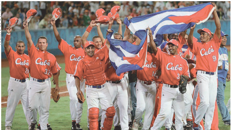
El béisbol cubano brilló en Juegos Olímpicos.