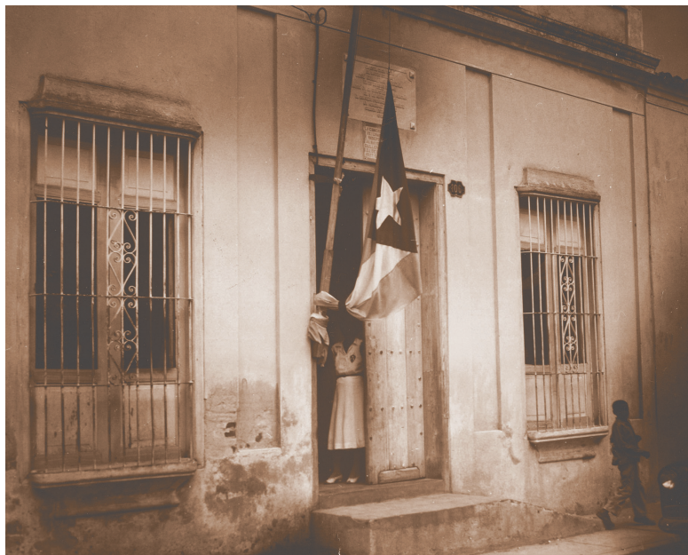
Autor no identificado

Su casa en Santiago de Cuba aún se conserva.