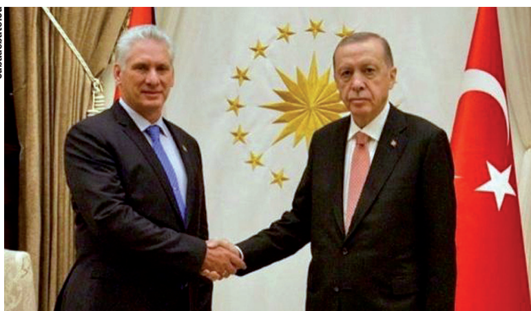
En un encuentro oficial entre el presidente cubano y su par turco Recep Tayyip Erdogan.