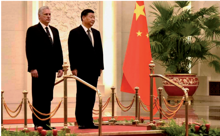
Díaz-Canel en China fue recibido por su homólogo Xi Jinping a quien le agradeció la ayuda y el reconocimiento de la capacidad de resistencia del pueblo cubano frente a las adversidades.

dejar de saludar a Guennadi Andréyevich Zugánov, secretario general del Partido Comunista de Rusia; rendir tributo a los soldados soviéticos caídos en la Gran Guerra Patria; y, como hecho singular, visitar la sede del canal RT. Díaz-Canel Bermúdez realizó una intervención especial ante el Parlamento ruso agradeciendo el apoyo que siempre han brindado los diputados eurasiáticos. Recibido por su presidente Vyacheslav Volodín, el jefe de la delegación cubana dijo “que los nexos parlamentarios constituyen un importante pilar de los vínculos bilaterales” y “pieza clave para el desarrollo de los lazos económicos, comerciales, y financieros”.