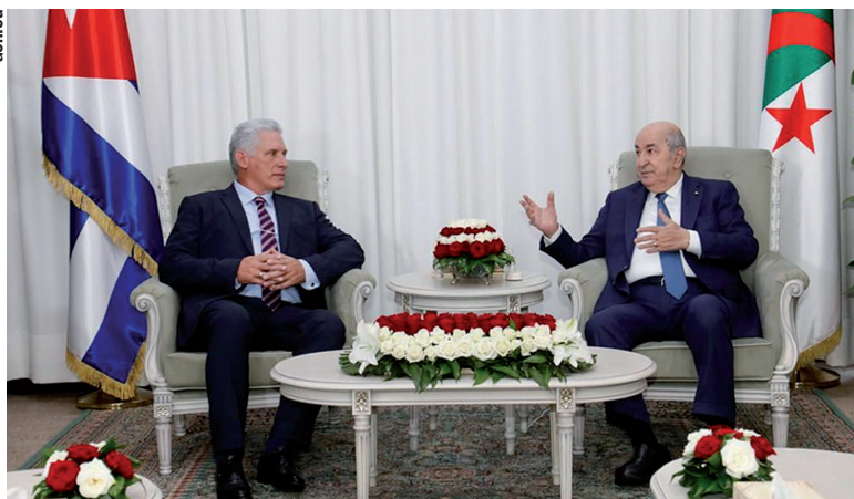
La estancia argelina marca un hito en el desarrollo de las relaciones bilaterales.

expresó que las sanciones contra Cuba y Rusia no pueden –ni podrán– ralentizar la cooperación económica entre nuestros países porque se trata de una