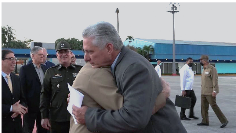
El 6 de noviembre, Miguel Díaz-Canel Bermúdez antes de iniciar su recorrido fue despedido, en La Habana, por el general de ejército Raúl Castro Ruz y otros altos dirigentes.