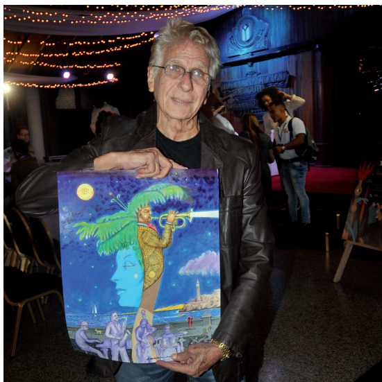
Bobby Carcassés, Premio Nacional de Música, se distingue por su talento y magisterio.

Aventuras infinitas protagonizan músicos de diferentes generaciones, dominan una técnica de alto nivel, para ellos no existen fronteras entre la música culta y la popular. De hecho, conciben repertorios en correspondencia con la actualidad mundial en beneficio del gusto de las mayorías.