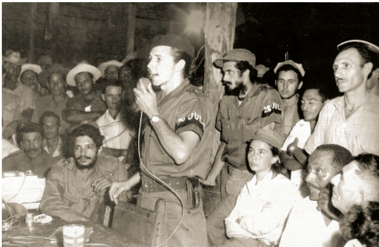
Raúl Castro en el Congreso Campesino en Armas.