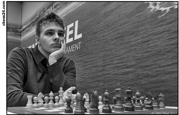
El talentoso Gran Maestro húngaro Richard Rapport da muestras de su talento, en medio de una versátil estrategia.