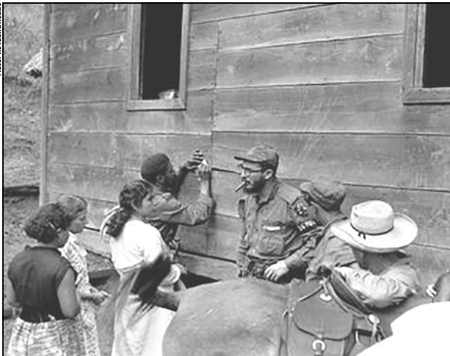
Fidel y los campesinos de la Sierra Maestra. Su reunión con los caficultores de la zona en Las Vegas de Jibacoa el 25 de mayo de 1958, constituye el antecedente directo del cónclave de Mayarí Arriba.