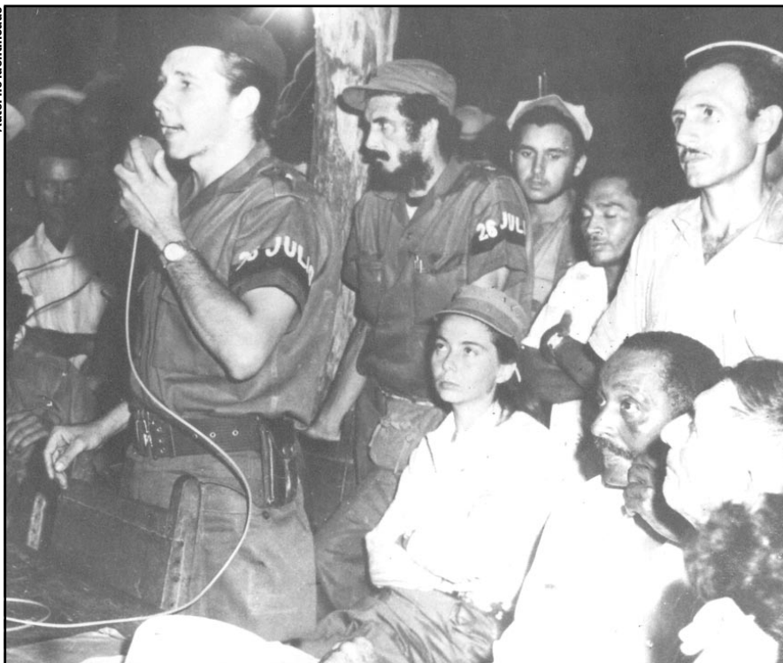
El entonces comandante Raúl Castro Ruz presidió el Congreso.