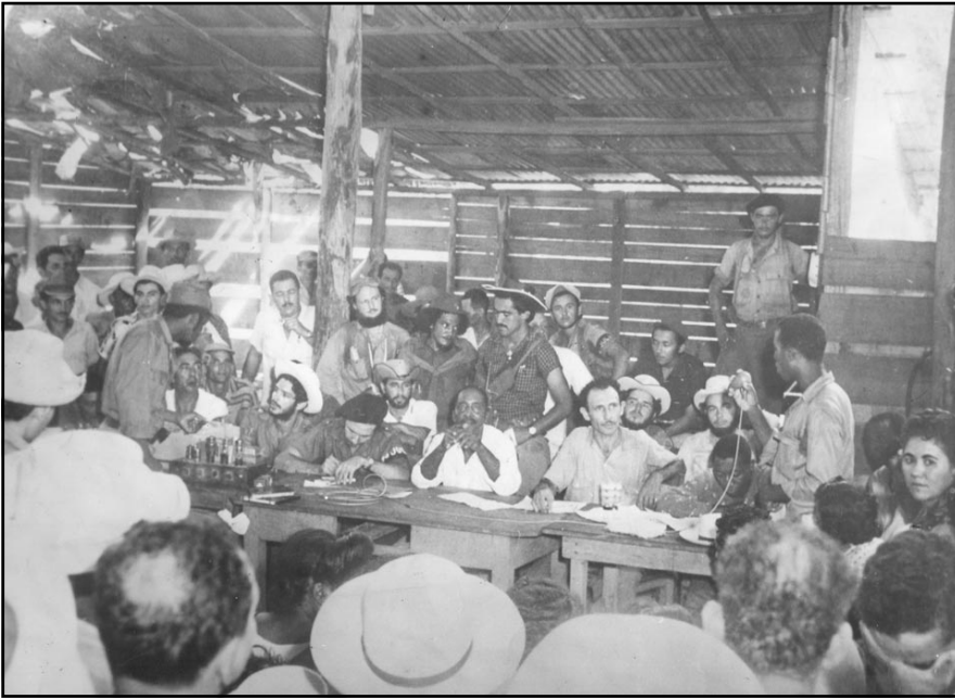
Una de las sesiones del evento que contó con la participación de 203 delegados, entre los que se contaban cinco mujeres.

convocado con el propósito de aunar los esfuerzos del campesinado, para junto al glorioso Ejército Rebelde liberar a nuestra patria de la tiranía batistiana que hace ratos padece nuestro pueblo”.