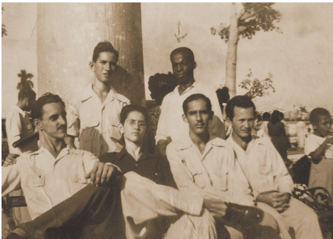
Con algunos amigos y compañeros de lucha, en una fecha aún no precisada de la década del 50.

H ACE algunos años, una joven egresada universitaria interesada en investigar el movimiento revolucionario en La Habana durante la tiranía batistiana fue a buscar información con