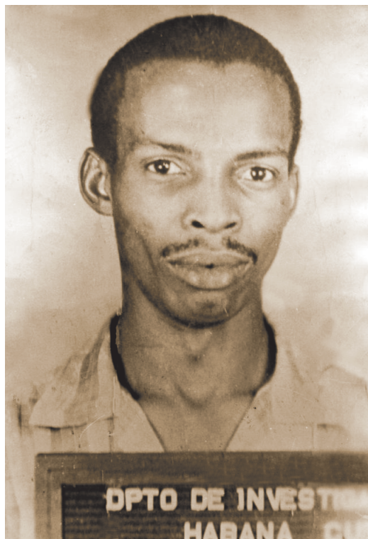
Imagen perteneciente a su ficha policial existente en los archivos de los aparatos represivos de la tiranía batistiana.

El entonces presidente de la Asamblea Nacional del Poder Popular accedió gustoso a la petición de la muchacha. “Eso era él, extraordinario”, le dijo. “Nacido en la mayor pobreza en [la barriada] el Condado, de Santa Clara, era un niño negro condenado como tantos otros a padecer una vida triste de la que nadie hablaría nunca [...] Y aquel niño se transformó en héroe. Él se levantó desde la miseria hasta convertirse en jefe indiscutido y crear barrio por barrio la mayor fuerza revolucionaria de la capital, y a dirigirla.