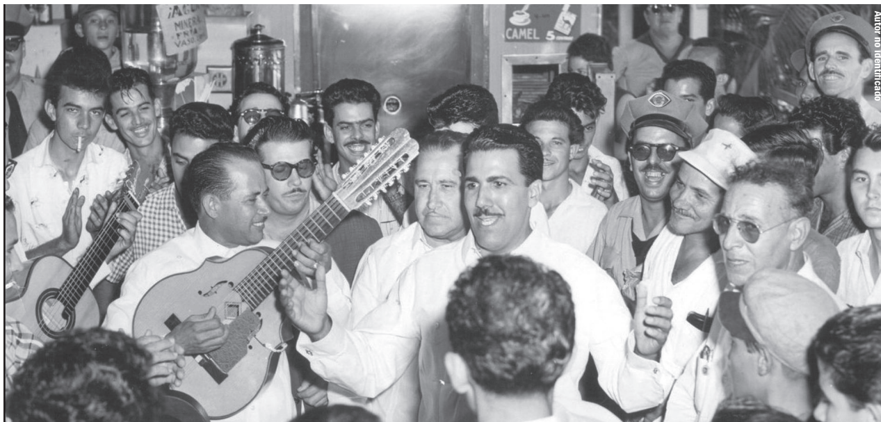
Un poeta muy querido, por su carácter sencillo y afable.

Sin traicionar a la poesía, Naborí ensanchó sus horizontes profesionales. En 1939 ya había escrito su primer libro: Estampas campesinas , publicado siete años más tarde bajo el título de Guardarraya sonora .