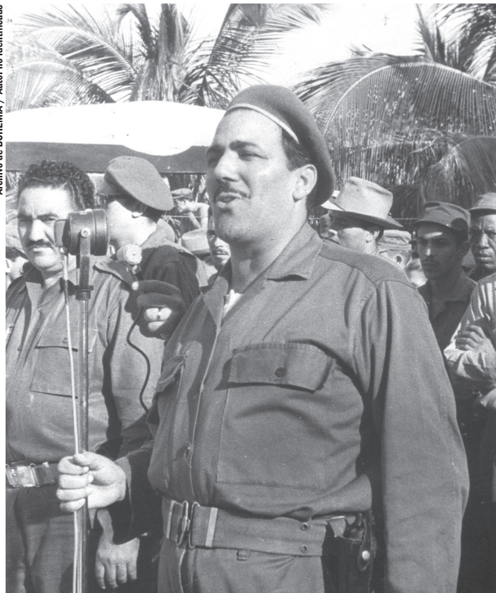
Cuando la invasión a Girón, Naborí estaba al frente de los alfabetizadores en Varadero y se vistió de miliciano.

El elegante de la décima esperó el triunfo con un canto épico: la Marcha triunfal del Ejército Rebelde , uno de los himnos políticos más reproducidos en Cuba. La oda vio la luz en esta revista en la segunda parte de la Edición