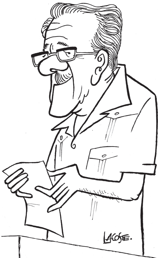
Una de las grandes voces poéticas de Cuba del siglo XX.