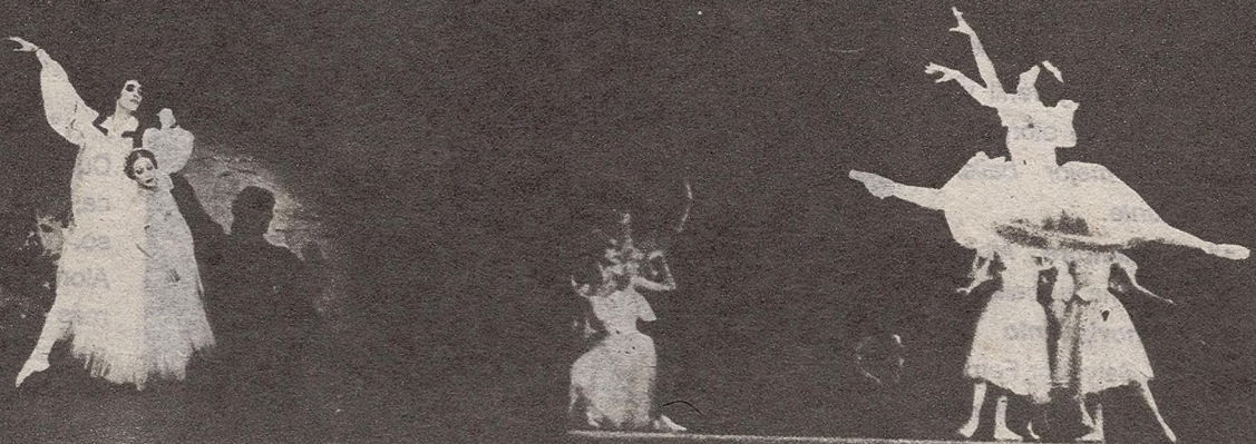
Aurora Bosch como Myrtha, la reina de las wilis, de Giselle , interpretación que le valió importantes premios internacionales.