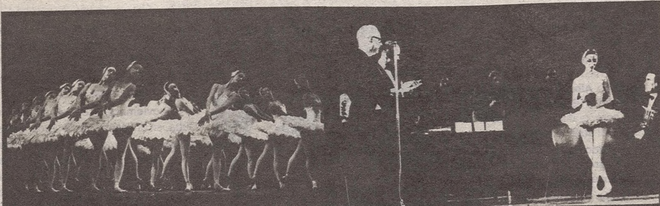
El Ballet Nacional de Cuba en el segundo acto de El lago de los cisnes .