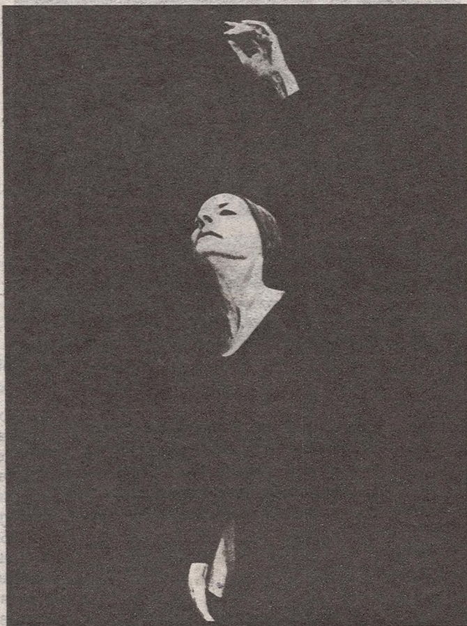
Alicia Alonso, prima ballerina assoluta y directora general del Ballet Nacional de Cuba.

28 diciembre. La agrupación incluye en su repertorio el ballet Coppélia , con