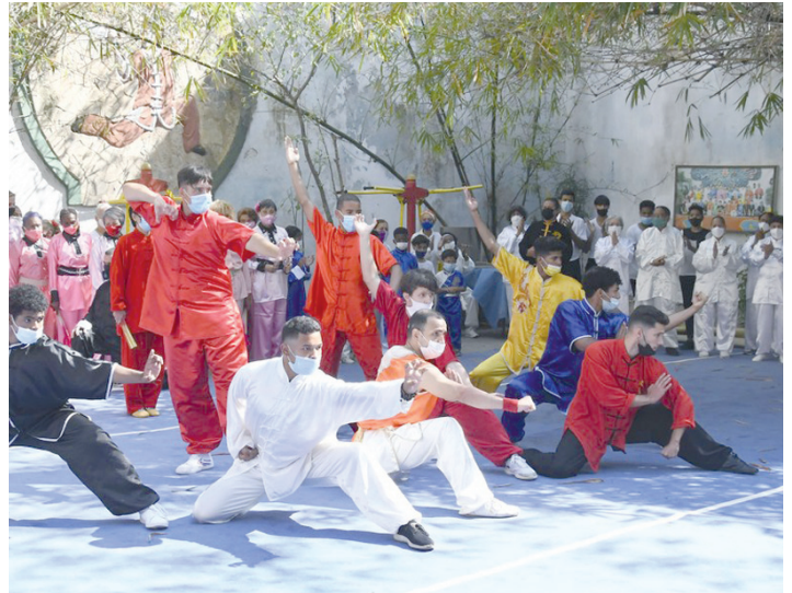
Proyecto Wushu (Barrio Chino de La Habana). Spanish.xinhuanet.com