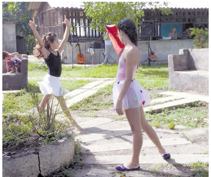
Proyecto Venga la Esperanza. ahora.cu