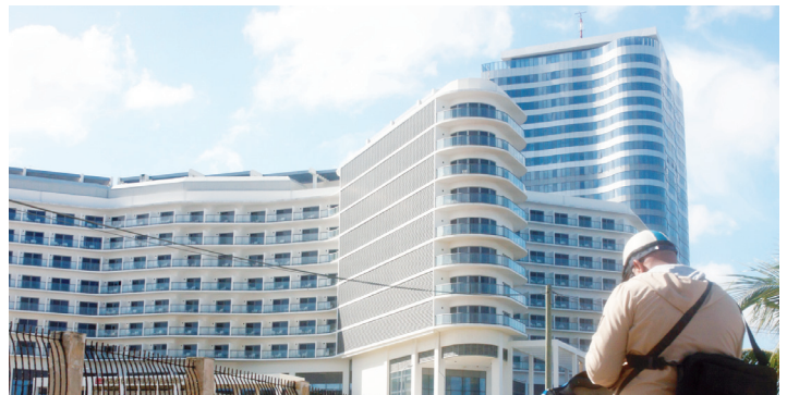
Infraestructura turística: Polo turístico de Monte Barreto. Playa, La Habana (1979-Actualidad). YASSET LLERENA ALFONSO