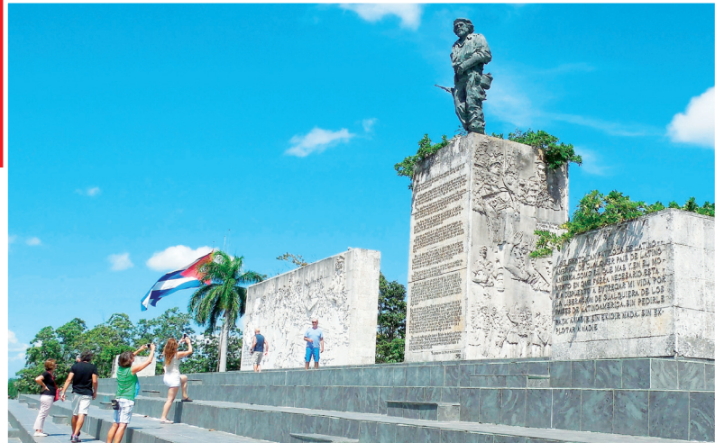
Patrimonio e historia: Complejo Monumental Ernesto Che Guevara. Santa Clara, Villa Clara (1988). MARTHA VECINO ULLOA