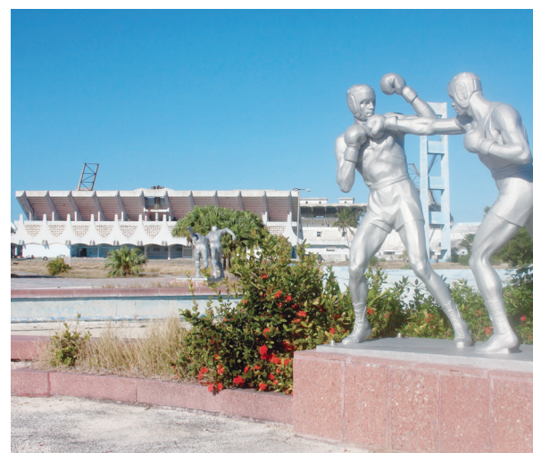
Desarrollo deportivo: Estadio Panamericano. La Habana (1991).