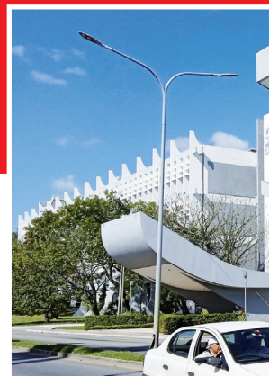
Padre de las ciencias: Centro de Ciencias de la Salud