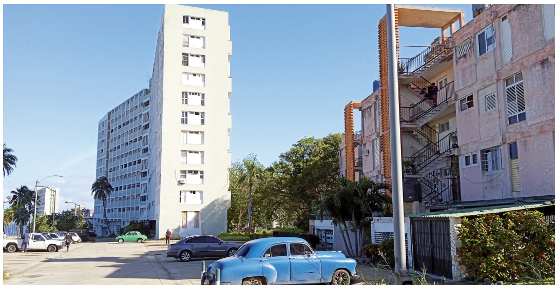
Primera localidad construida: Ciudad Camilo Cienfuegos. La Habana del Este, La Habana (1959-1965).