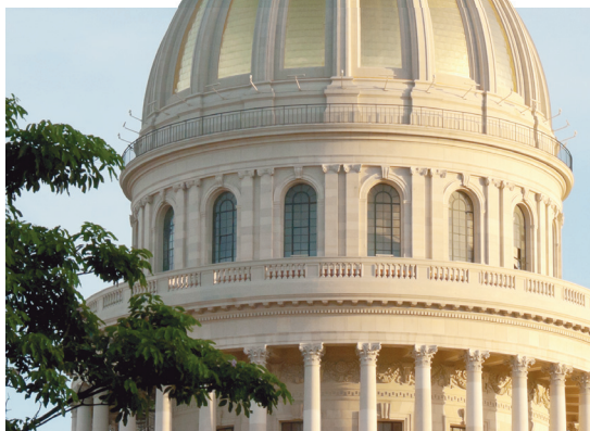
Restauración de monumentos: Capitolio Nacional de Cuba. La Habana Vieja (2019, reinauguración). YASSET LLERENA ALFONSO