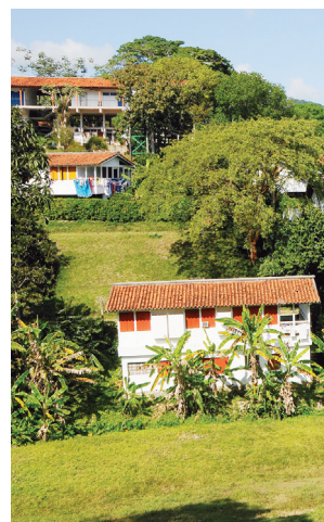
Paisaje cultural: Conjunto Urbano Nido de Colibrí, Artemisa (1971)