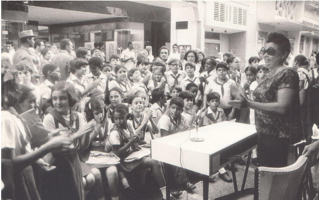
A la entrada de la librería habanera Vietnam Heroico, en octubre de 1979, la escritora presenta Diario de una rosa .