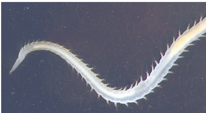
La biodiversidad abisal revela formas de vida asombrosas adaptadas a la presión extrema.

Un artículo publicado en Nature Communications , titulado Assessing the impact of the global subsea telecommunications network on sedimentary organic carbon stocks , advierte cómo los cambios en la salinidad, la temperatura o el aporte de agua dulce podrían alterar el flujo de esta cinta transportadora. Las consecuencias serían devastadoras: la interrupción de este equilibrio desencadenaría fenómenos extremos como sequías, olas de calor marítimas o modificaciones en la intensidad de los huracanes, lo que subraya la importancia de mantener este sistema en aras de sostener la vida marina y humana.