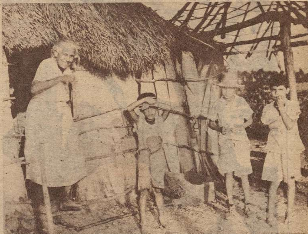
Un amplio reportaje sobre el desalojo publicado en 1951 atrapaba también imágenes de la pobreza padecida por nuestro campesinado.